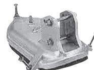
ヒューム管用パット