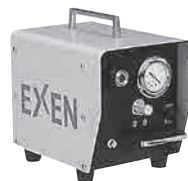
バキュームポンプ